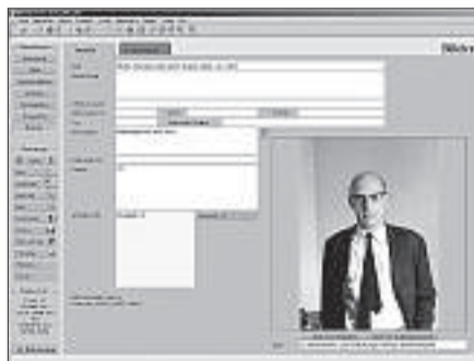
Lit-link erlaubt auch die Bildverwaltung.